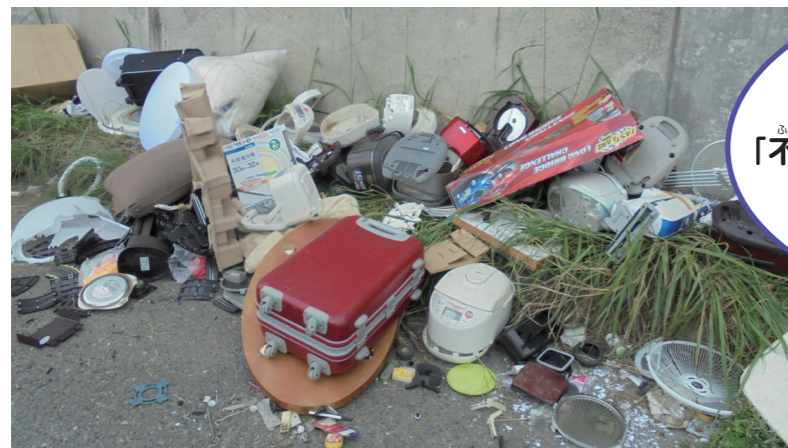
道路に不法投棄されたごみ