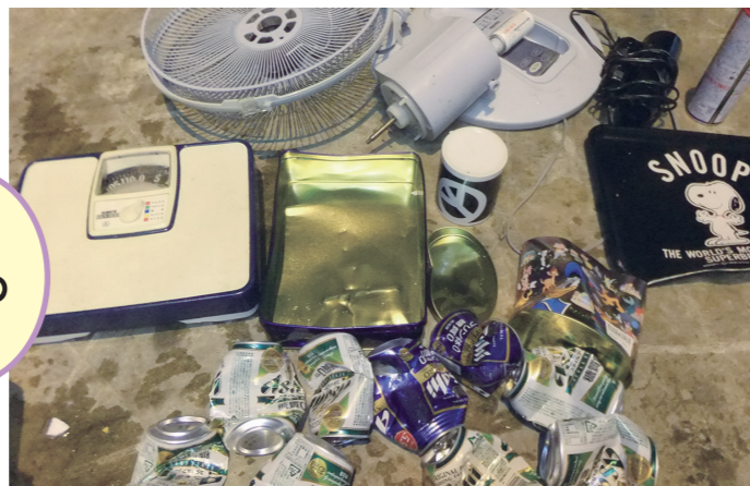
「もえるごみ」の袋で出されたごみ

いらなくなったものを 道路や山に捨てたりすることは、 「不法投棄」と言って環境をよごしたり、 近くの住民のめいわくになったり するんだよ。