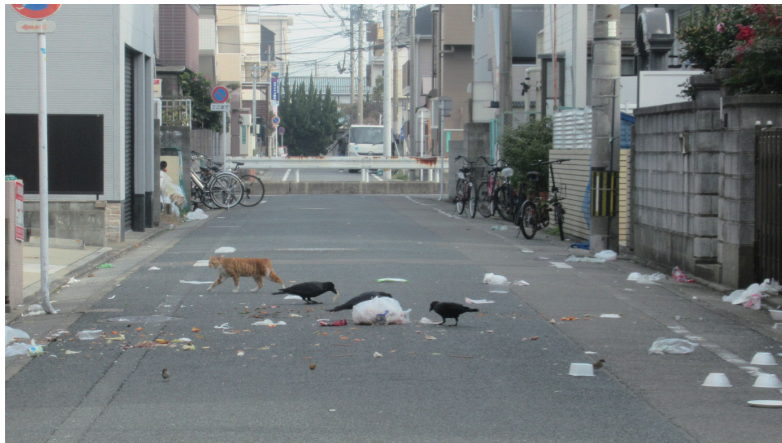
カラスにあらされたごみ

うわっ!? これはひどい… カラスに荒らされないように、 ごみを出す時間を守らないと いけないね。